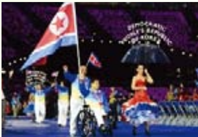
▲ 북측 선수들의 입장모습

2012 London Paralympic Games 런던 장애인 올림픽 (2012.8.30~9.10)