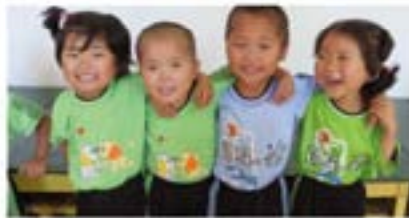
▲ 사리원 애육원 5세~6세