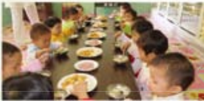
▲ 황해북도 육아원 1세~4세

푸른나무는 북한 전역의 고아 아이들인 육아원(0~4세), 애육원(5~6세), 초중등학교원(7~16세)의 어린이들을 위한 식량지원, 영양증진, 생필품 보급, 교육환경 개선등을 지원하며 정치적 이념을 떠나 통일 시대를 열어갈 다음세대인 어린이들이 신체적, 정신적으로 건강하게 성장해야 건강한 남북의 미래를 만들어 갈 수 있기를 소망합니다.