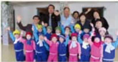
▲ 해외동포후원자와 원산애육원 원아