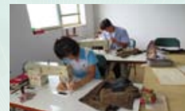
▲ 장애인 직업재활 재봉교육