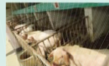
▲ 동물기르기 사업