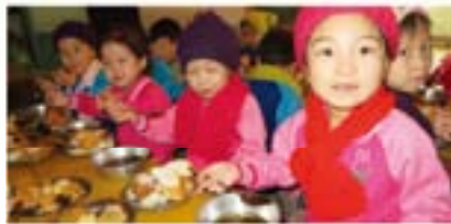
▲ 원산애육원 5세~6세