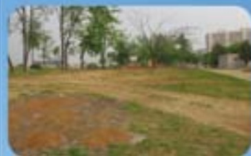
▲ 대동강 장애인 회복원 건축 부지